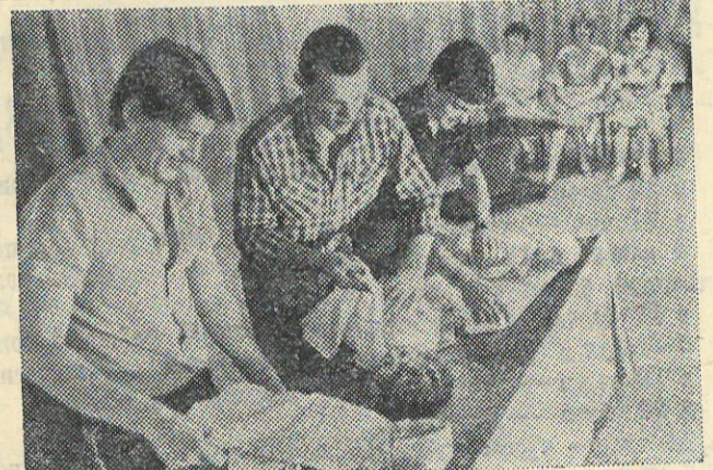
Киргизская ССР. В небольшом городке Майли-Сае 13 женсоветов, и каждый по-своему значителен и оригинален в работе с общественностью. Круг решаемых ими вопросов широк и разнообразен, охватывает практически все, из чего складывается жизнь и дела женщин. А их здесь — большинство. К тому же город этот молодежный, средний возраст жителей — 30 лет. Благодаря женсоветам, успешно решаются многие вопросы, связанные с бытовым обслуживанием, торговлей товарами повседневного спроса, досугом. На снимке: в клубе молодой семьи. Кто из пап лучше запеленает куклу?.