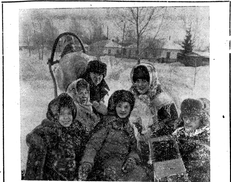
Омская область. Самодеятельные артисты совхоза «Кирсановский» — самые активные организаторы и участники всех сельских праздников. Земляки с удовольствием слушают выступления и хора ветеранов, и фольклорного ансамбля. На каждой животноводческой ферме знают свою агитбригаду и ждут с интересом ее приезда.

Из унижения и пепла, Каленых заполярных стуж, Промозгой сырости бараков, Рассеять ясным светом душ Зло торжествующего мрака. Мы, Ваши внуки и сыны, И нам сквозь давние заслоны И до сих пор еще слышны Проклятья горькие и стоны Всех тех, Прочел сквозь ужасы затмения. Зачем? За что? И чести нам, Увы, не делает прозренья.