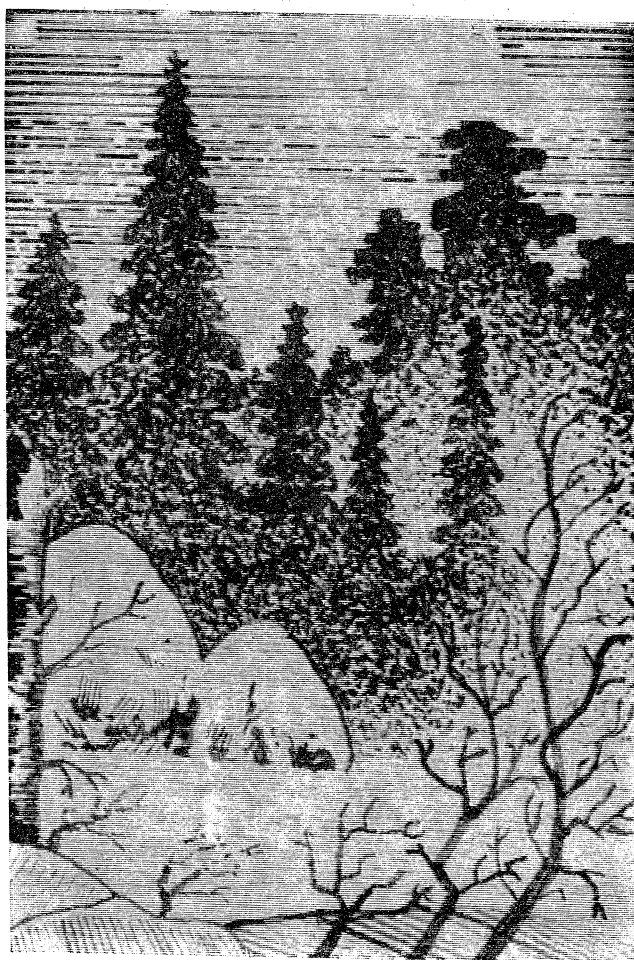
В. БОРЗЕЦОВ. Рисунок автора.