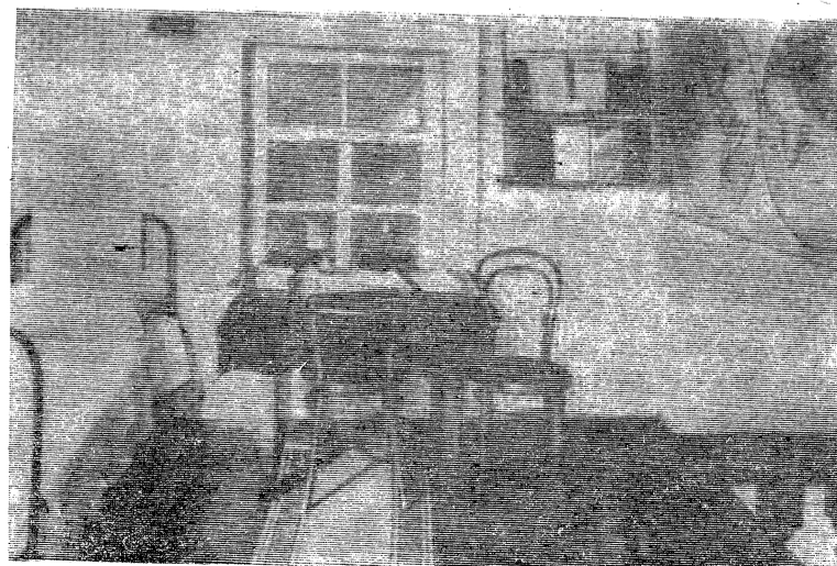
Текст и фото В. БОРЗЕЦОВА.