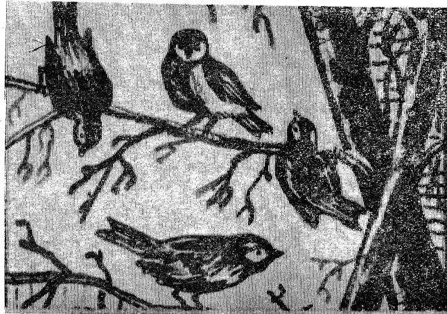
Рисунок В. БОРЗЕЦОВА.

4-е место, Уренгойская школа № 2 — 5-е, Самбургская — 8-е, а Таркосалинская школа № 2 — 9-е место. Последние места у малокомплектных школ — Губкинской и Пуровской.