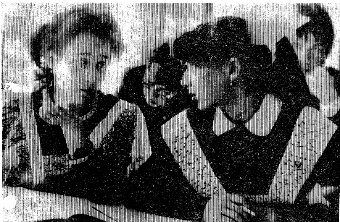
Фото и текст В. БОРЗЕЦОВА.

Впереди у выпускников несколько недель напряженного труда, труда с зримо обозначившимся конечным результатом. Что там будет в аттестате: тройки, четверки, пятерки?