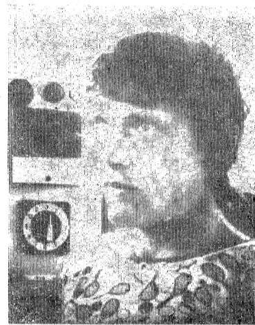
● ФОТОРЕПОРТАЖ С ПЕРЕДНЕГО КРАЯ