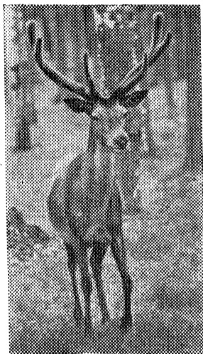
Украшение Беловежской пуши — европейский благородный олень.

ный журнал. 10.00 Очевидное — невероятное. 11.00 Сегодня в мире. 11.20 Торжественное открытие XXIV летних Олимпийских игр. Передача из Сеула. 15.00 Родительский день — суббота. 16.30 Международная программа. 17.30 Песня-88. 17.50 Минуты поэзии. 17.55 Премьера мультипликационных фильмов для взрослых: «Наедине с природой», «Гром не грянет», «Отель», «Стрелочник». 18.20 Фотокурс «Я люблю тебя жизнь». 18.25 Художественный фильм «Мой друг — человек несерьезный». 20.00 Время. 20.35 Проектор перестройки. 20.45 В субботу вечером. «После спектакля». Театральный капустник. 21.55 Новости. 22.00 Концерт группы «Дайер Стрейтс» и Э. Клэптона на стадионе Уэмбли.