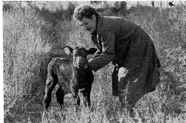
Совхоз «Новокарасуский», Крутинского района — один из крупных по сельскохозяйственным угодьям не только в районе, но и в Омской области.

Есть на территории совхоза и заброшенные деревни. Одна из них была — Старице. Решили здесь построить новую деревню, в которой создать отделение. Чуть меньше года потребовалось совхозным строителям, чтобы построить 18 коттеджей.