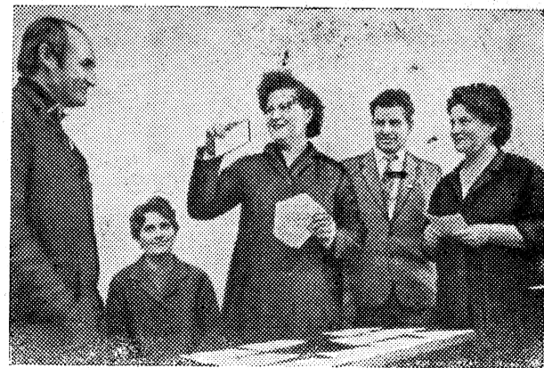
фабрики, отпразднуют новоселье; распределение квартир проходило справедливо, поэтому обижаться не на кого.

На снимках: скоро в 88-квартирном доме, построенном хозспособом, работниками Брянской мебельной