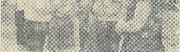
Литовская ССР. С начала нынешнего года работает в Вильнюсе вневедомственный контроль качества строительства.

И. БАРАНИКАС, корреспондент АПН. Вильнюс — Москва.