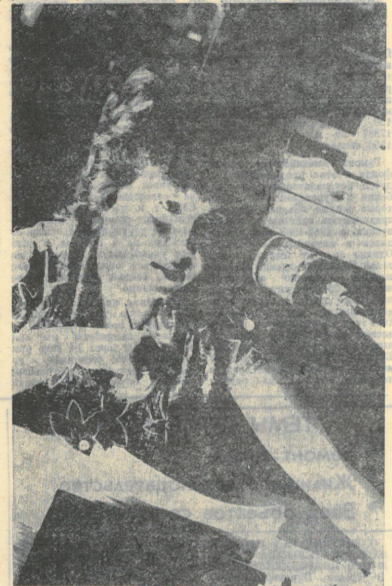
Радиооператор любой службы — ее нерв. Он связывает невидимой нитью подразделения этой службы, где бы они ни находились: на земле или под землей, на море или в его глубинах, в небе, а теперь даже и в космосе. И часто от радиста зависит не только успех в работе людей, но и их здоровье, а бывает, и жизнь.

Самим советом утрачено руководство, нет владения оперативной обстановкой и анализа ситуации. Не в том ли причина, что при зачете пунктов коллективного договора против многих пунктов приходилось делать отметку — «минус», «не