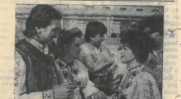
В Тюмени состоялся советско-болгарский фестиваль самодельного творчества «Алеша». На площадках города советские и болгарские коллективы художественной самодеятельности показали свое искусство, которое имеет одни и те же корни славянской культуры. На снимке: интернациональный ансамбль танца «Младость» болгарской строительной группы города Тюмени. (Фотохроника ТАСС).

СФК выступает за возвращение исконных названий многим городам страны, известным с IX-XIV веков, невзирая на то,