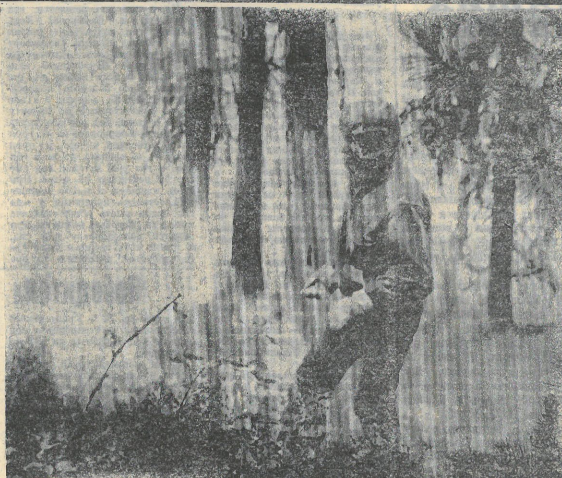
На снимках: моменты тушения лесного пожара.