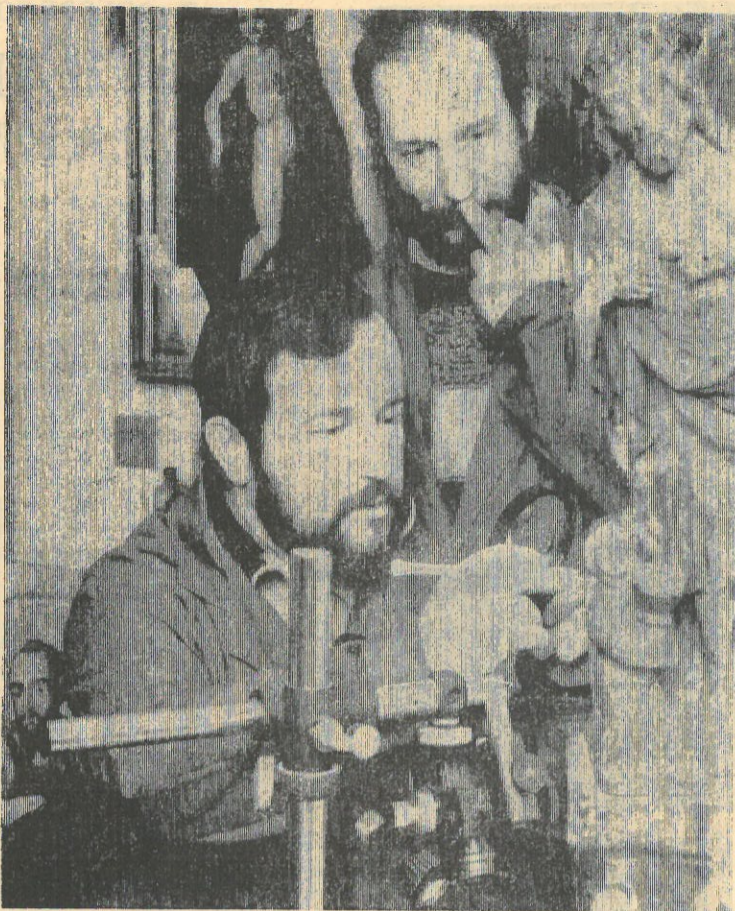
Украинская ССР. Одним из первых экспонатов музея древнего Львова, который откроется в этом году, станет скульптура «Страждущий Христос» (со сценой «Пьета с Донатором»). Найденная на чердаке костела Иоанна Крестителя скульптура, датируется XIV веком. Она была разбита на 22 части. Реставраторы Львовской картинной галереи восстановили ее и теперь расчищают от поздних красочных слоев разных времен.

М. ИБАТУЛЛИН, собкор газеты «Татарская молодежь».