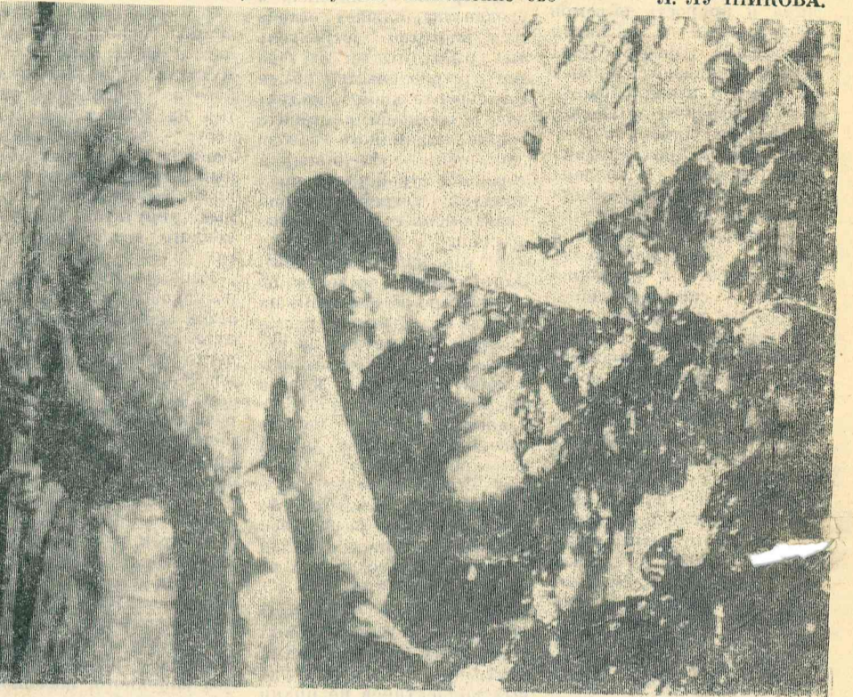
На сцене: на детских новогодних утренниках, главным действующим лицом — Дед Мороз. Без него и праздник не весел. Он всегда желанный гость.