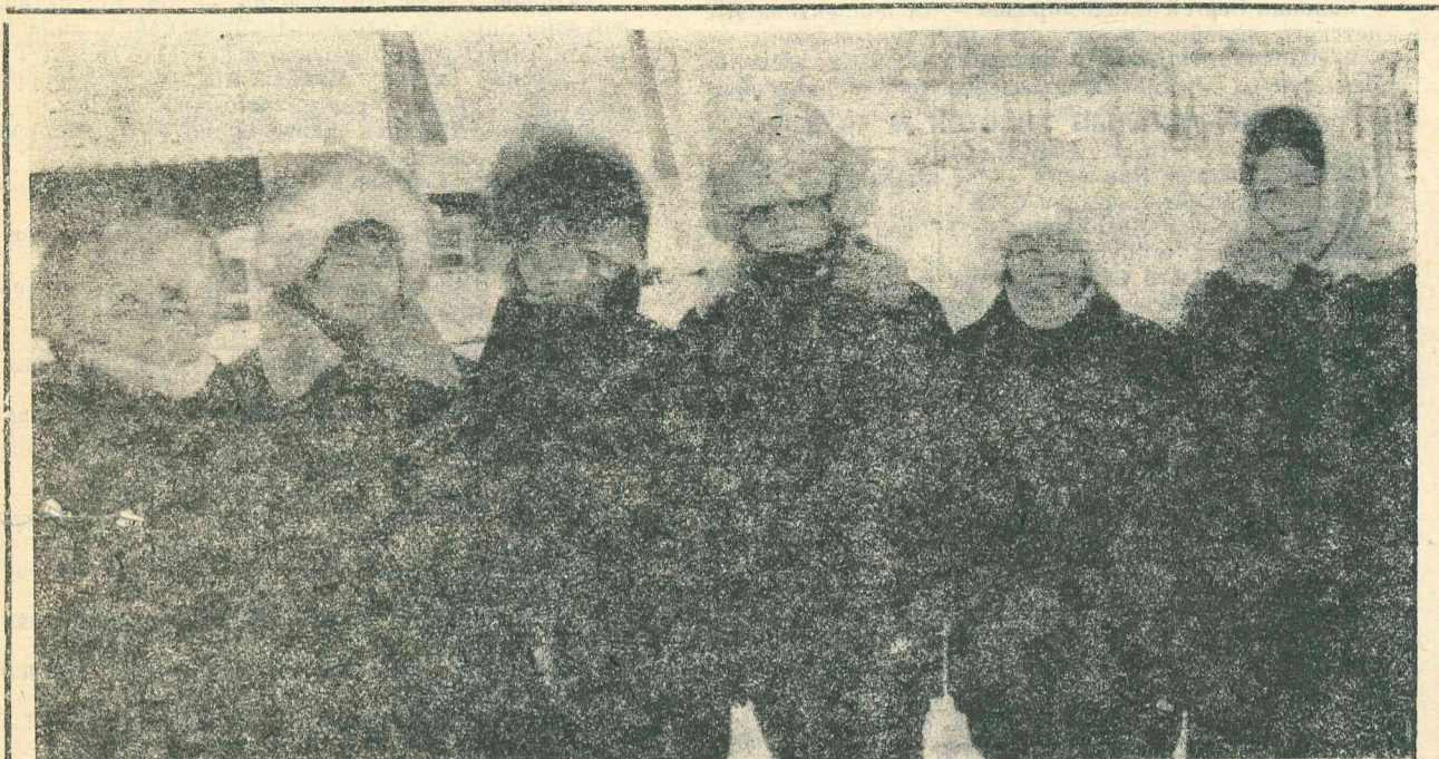
От правильности ухода за песцами зависит качество пушнины. Это хорошо понимают рабочие зернофермы совхоза «Верхнепуровский», которые в своей работе прикладывают много стараний и усилий.

ОРГАН ПУРОВСКОГО РАЙОННОГО КОМИТЕТА КПСС И РАЙОННОГО СОВЕТА НАРОДНЫХ ДЕПУТАТОВ ЯМАЛО-НЕНЕЦКОГО АВТОНОМНОГО ОКРУГА ТЮМЕНСКОЙ ОБЛАСТИ