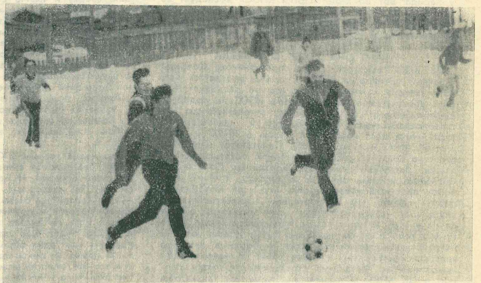
НА СНИМКЕ: момент встречи лидера турнира командой Факел с лидером командой Старт.