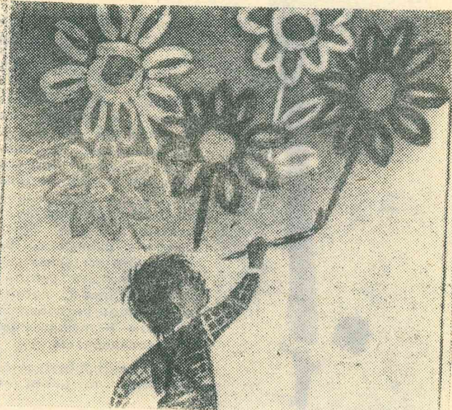
ЛЮДИ! БУДЬТЕ БДИТЕЛЬНЫ. БЕРЕГИТЕ МИР.

После открытия государственных границ ГДР с ФРГ и Западным Берлином влияние правых сил на молодежь значительно усилилось. Западногерманская партия «республиканцев» пытается образовать единый блок со своими единомышленниками из ГДР. Фундаментом, на котором формируются идеологические взгляды неонацистов, служат все та же «Майн кампф» Гитлера, которую теперь почти открыто вводят в ГДР. Во многих ее городах «республиканцы» распространяют листовки, навязывают прохожим всевозможные рекламные издания, пропагандирующие неонацистские и расистские взгляды. Используя свободу передвижения и спекулируя на проблемах, стоящих сегодня перед ГДР, идеологи правых убеждают, что только силой оружия, «твердой рукой» можно добиться социальной справедливости. Вновь протаскиваются идеи лик-