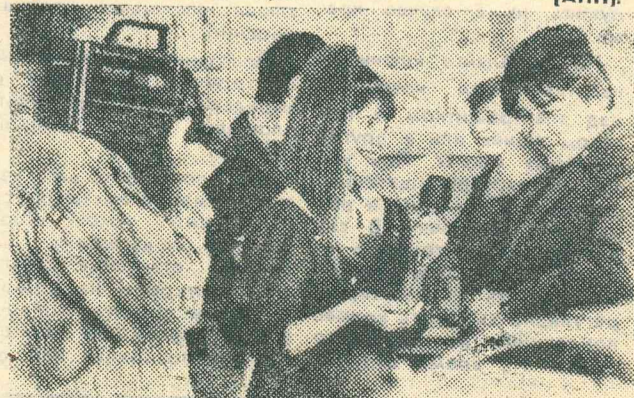
ОМСК. В средней школе № 46 работает собственное телевидение. Снимают на пленку школьные собрания, внеклассные мероприятия. Записывают и учебные передачи, которые служат хорошим подспорьем для учителей.