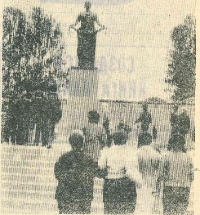
МЕМОРИАЛ «ПИСКАРЕВСКОЕ КЛАДБИЩЕ» В ЛЕНИНГРАДЕ.