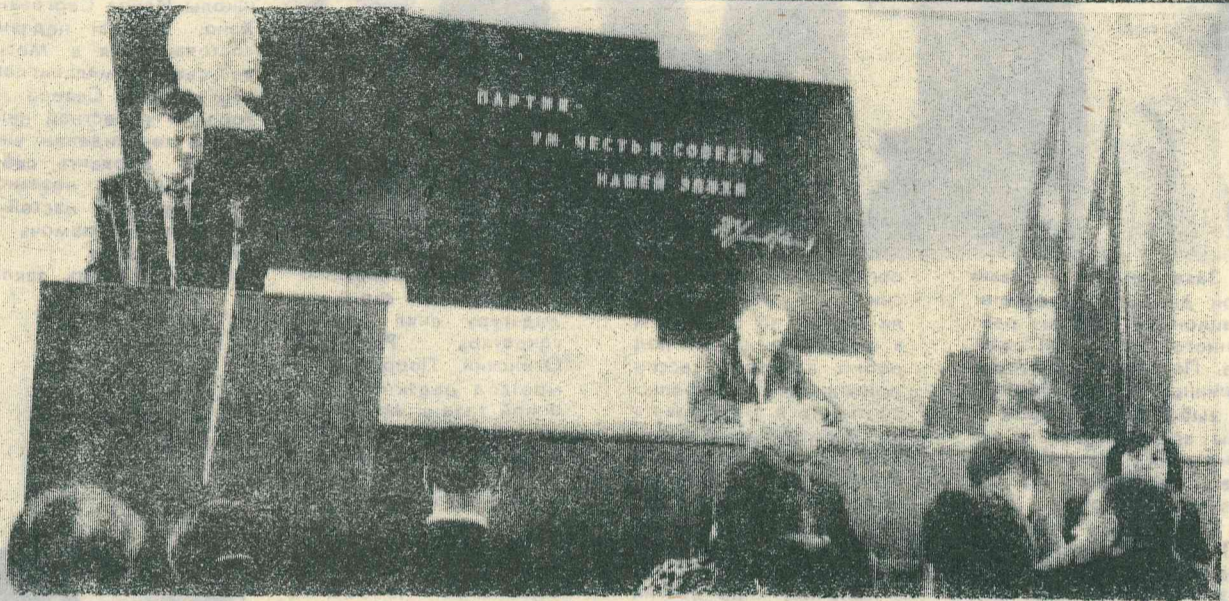
ВО ВРЕМЯ РАБОТЫ ПЕРВОЙ СЕССИИ ПО ТЕХНИЧЕСКИМ ПРИЧИНАМ ДЕПУТАТАМ ПРИШЛОСЬ ПОМЕНЯТЬ ЗАЛ ЗАСЕДАНИЙ.

Первая организационная сессия районного Совета народных депутатов продолжит свою работу 22 мая 1990 года в ДК «Юбилейный» п. Тарко-Сале.