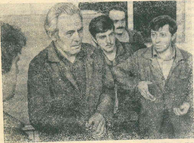
В коллективах идет обсуждение работы годовых организационных сессий нового состава районного, поселковых и сельских Советов.

ОРГАН ПУРОВСКОГО РАЙОННОГО СОВЕТА НАРОДНЫХ ДЕПУТАТОВ ЯМАЛО-НЕНЕЦКОГО АВТОНОМНОГО ОКРУГА ТЮМЕНСКОЙ ОБЛАСТИ И РАЙОННОГО КОМИТЕТА КПСС.