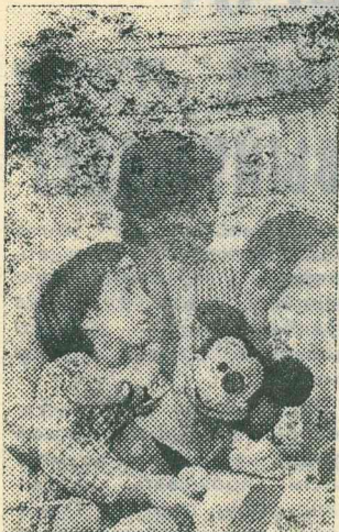
Мы, родители выпускников детского сада «Елочка» п. Тарко-Сале, хотим

от всей души сказать большое спасибо коллективу детского сада за хорошую подготовку наших ребят к школе, за ласку, внимание и заботу, которыми были окружены наши дети. Малышами пришли они в детский сад, но вот пролетели годы — пора идти в школу. Оглядываясь сейчас назад и сравнивая наших теперешних ребят с теми несмышляшками, мы видим, как много вложено в них сил, сколько положено труда, чтобы научить и обучить, привить необходимые навыки.