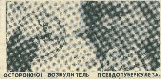
ОСТОРОЖНО! ВОЗБУДИТЕЛЬ ПСЕВДОТУБЕРКУЛЕЗА.