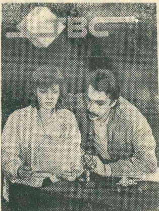
Тысячи жителей Барнаула по вечерам дружно переключают свои телеприем-

ники на третью программу: в городе начала работу акционерная телекомпания «Сибирь». Пока ее передачи идут в течение двух часов после завершения работы краевого телевидения и на его оборудовании, и пока только для жителей Барнаула. В перспективе «Сибирь» смогут смотреть жители других регионов.