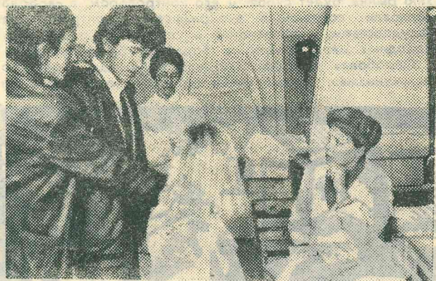
Цехи рыбообработки ждут молодые кадры

А вот с кадрами в цехе дела обстоят плохо. Нет грузчиков, обработчиков, то есть нужны рабочие руки. Холодно, сыро, а потому люди не хотят идти в цех. Сейчас у нас работают практиканты из Тобольского рыботехникума и из Салехарда. Но это продлится еще пару недель, а потом они уедут. И на напряженное время весенне-летней путины останется в цехе всего лишь четыре человека. Приглашали жен