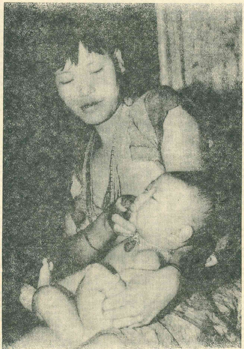
ТАЙВАНЬ. Тайбэй — крупнейший город Тайваня. Как и все крупные города Юго-Востока, он изобилует трущобами. На снимке: у этого младенца нет будущего.