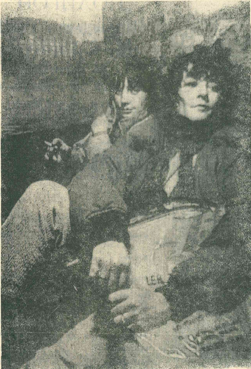
ПАРИЖ. Молодежь без какого-либо заглятя, безработные, практически лишившиеся всех прав, брошенные на произвол судьбы дети — кого только не найдешь здесь, на улице. Обычно они ходят по городу с пластиковыми сумками в руках в поисках пропитания, угла для ночлега или возможности помыться и постирать вещи. А успокаивает их лишь одна мысль: пасть ниже уже невозможно..

НАЛИСТОВ, А ВЕРНЕЕ БЫЛО БЫ СКАЗАТЬ — САМУ ЖИЗНЬ, «СДЕЛАННУЮ» НАШИМИ РУКАМИ. ТАК ДО СИХ ПОР БЫЛО, НО МЫ БОЛЬШЕ НЕ ХОТИМ НИЧЕГО НИ ЗА КОГО ДЕЛАТЬ. И ЕСЛИ В РАЙОНЕ ВСЕ-ТАКИ ЕСТЬ МОЛОДЕЖНАЯ ЖИЗНЬ, ТО ПУСТЬ ОНА, НАША МОЛОДЕЖЬ, И ДОКАЗЫВАЕТ ЭТО. А ПОКА, ДОРОГИЕ ЧИТАТЕЛИ, БУДЕМ СМОТРЕТЬ НА ЧУЖУЮ ЖИЗНЬ, БУДЕМ СОЧУВСТВОВАТЬ ДРУГИМ. У НАС-ТО, ВИДИМО, ВСЕ В ПОЛНОМ ПОРЯДКЕ!