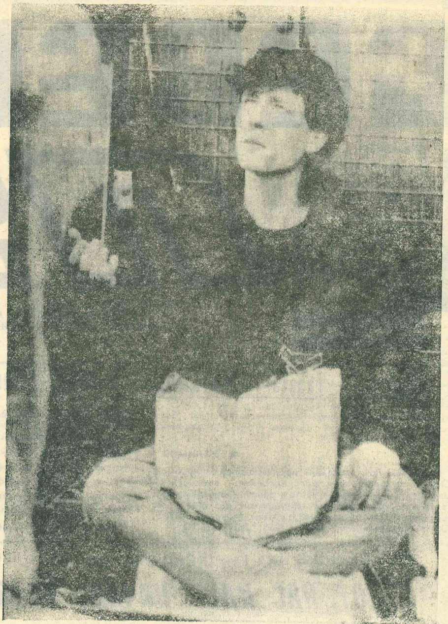
ЛОНДОН. Видимо, не все так уж благополучно в Британском королевстве, если этот молодой человек вынужден просить подаяние на улицах столицы. На плакате надпись: «Я голоден и не имею крыши над головой. Пожалуйста, помогите».