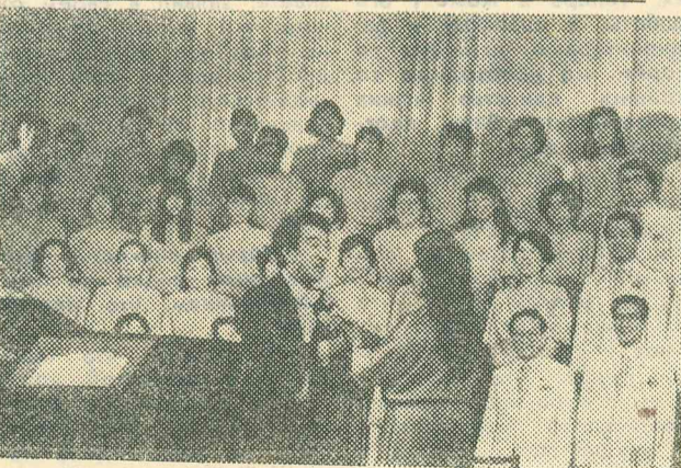
ПЕРМЬ. Редкая возможность представилась любителям классической музыки Перми — перед ними выступил камерный хор «Осака дайити» из Японии. В программе концерта — произведения Ф. Шуберта, К. Ямады, К. Хасимото, японские народные песни. На снимке: дирижер Такэо Сакурай принимает цветы от зрителей.