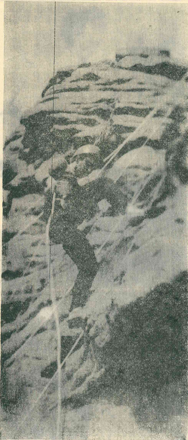
Три точки опоры. На соревнованиях по скалолазанию.