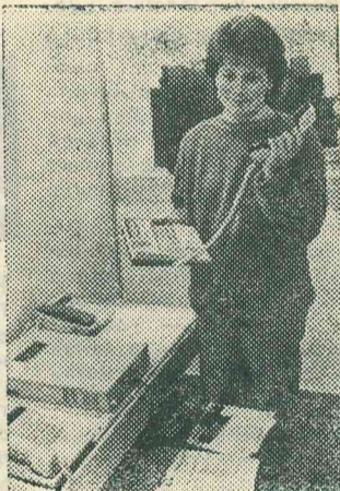
...Не спасает и «телефон доверия».

Такая политика эффективна вдвойне, когда и само государство осуществляет широкомасштабную политику поддержки и укрепления семьи. Например, Болгария с 1984 года ввела на первого ребенка 4-месячный оплачиваемый отпуск для одного из родителей с компенсацией в