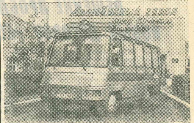
Одна из модификаций — грузо-пассажирский автобус на 12 пассажиров с платформой для перевозки 1,5 тонны грузов. Автобусы повышенной проходимости будут выпускаться для разных климатических зон страны.