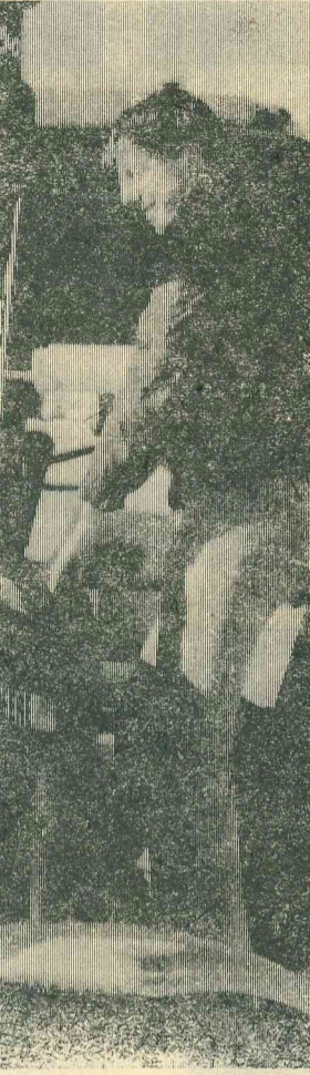
Только высокое качество труда может сделать советский рубль конвертируемым.

Однако и экономические реформы в свою очередь зависят от конвертируемости рубля. Поэтому в своей работе я предлагаю ряд мер по постепенному и взаимосогласованному продвижению к цели с «обоих концов». Иными словами, чтобы шаги по конвертируемости стимулировали переход к рыночным отношениям, а рыночные отношения создавали бы хозяйственно-политические предпосылки для введения все более развернутых форм обратимости рубля. В частности, я предлагаю упорядочение и ослабление валютных ограничений, существующих в нашей стране, либерализацию внешнеэкономичес-