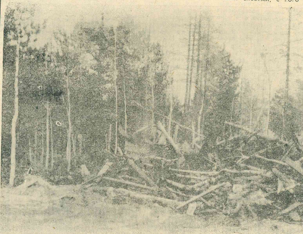
На страницах многих газет, журналов громко гласно звучат призывы: «За здоровьем в лес».