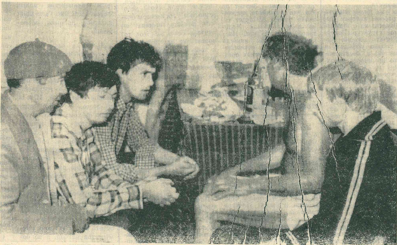
«КУЛЬТУРНЫЙ» ОТДЫХ В ОБЩЕЖИТИИ.