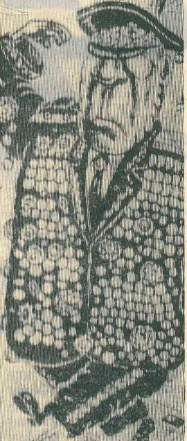
Многим был он не по духу,

Не давал резвиться кланам, в жизнь рабочего вникал. Понукал, конечно, планом, ну а кто не понукал? Строг был, но не зазнавался, в дружбу к сильному не лез. Ошибался? Ошибался! Но стоял-то за прогресс! Не качайте головами, не стучите кулаком. Нынче лихо судим с вами, а не задним ли умом?