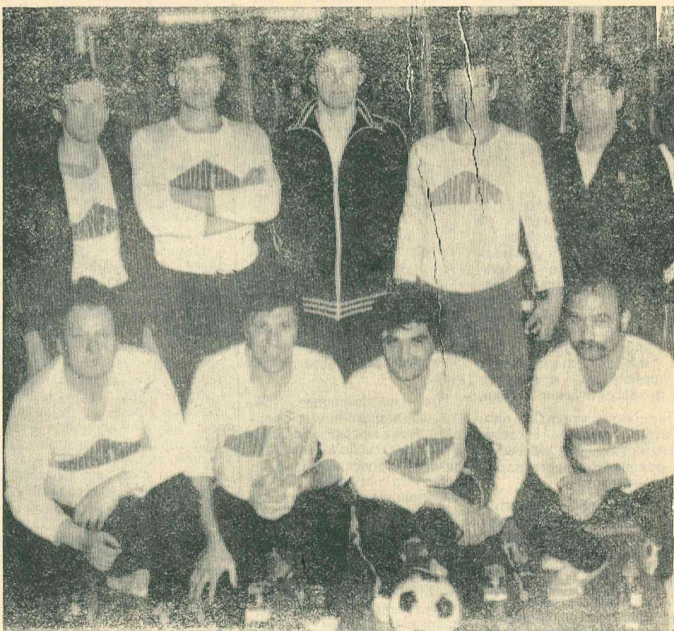
После трудных футбольных матчей команда «Авангард» Таркосалинского строительного управления подошла к финальным играм хотя и усталой, но настроенной на победу. И вот этот нас