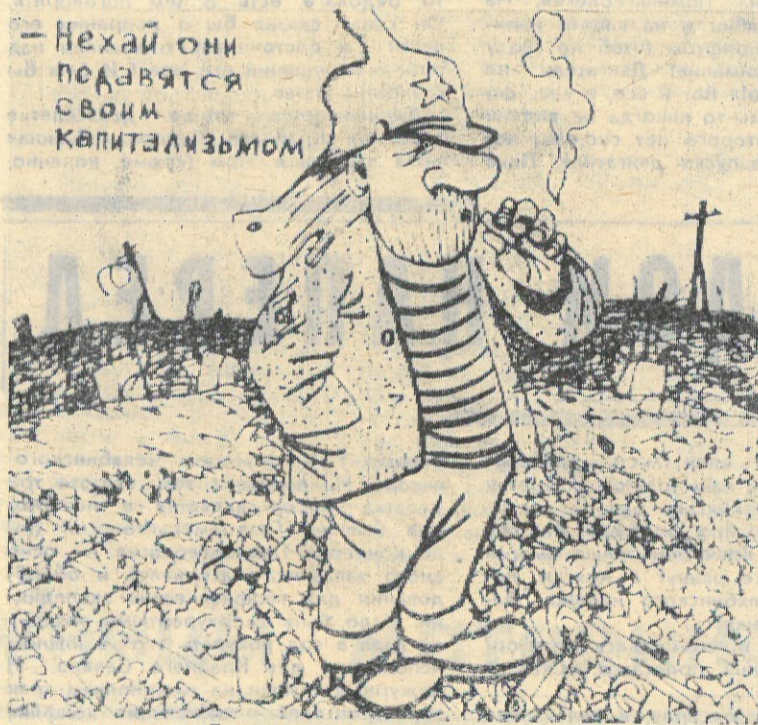
Рисунок из газеты «Тюменские известия»

(О нашей позиции и некоторых особенностях текущего политического момента)