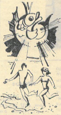
надеждой, Когда-то встретиться опять.

Свиданья миг настало краток: Ни делуев в нем, ни ласк, А только горечи осадок,