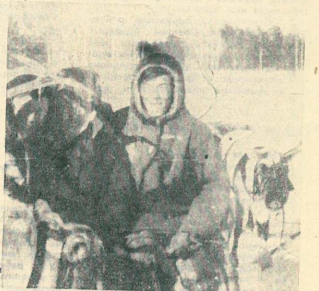
Весеннее солнышко «укротило» морозы, «съедает» сугробы, поэтому все реже мы видим в поселке оленьи упряжки, которые «прилетают» утром ранним, а «улетают» поздним вечером. Фотохудожник из Тарко-Сале.