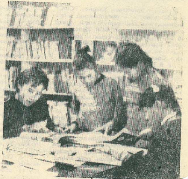
В последнее время в библиотеках наших поселков все чаще можно увидеть детей коренного населения: они искренне потянулись к книге — роднику знаний.