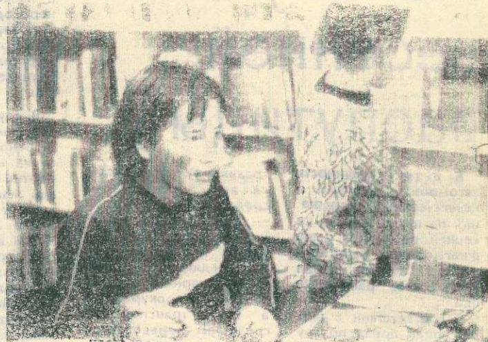
Ученики школы-интерната — дети тундровиков — в библиотеке.