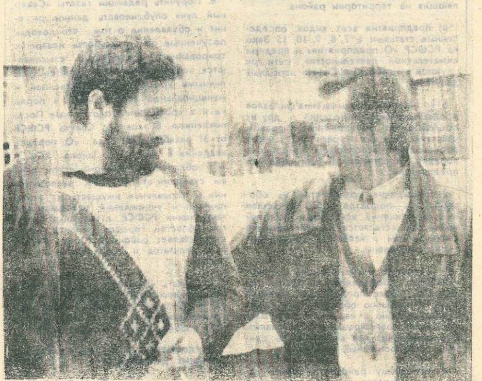
(Продолжение в завтрашнем № газеты)

— Приняв участие в работе этой сессии, я сделал вывод, что в райсовете слишком много депутатов. Из 74 присутствовали 54, но думаю, оптимальный вариант — это 20-25 человек. У нас в Ханымее 5 районных депутатов, но хватило бы и одного. Довольно большая часть депутатов — руководители подразделений или представители ведомств. На предыдущих сессиях, да и в прошлые времена, пока Советская власть не имела денег и выполняла чисто декоративную роль, представители ведомств поднимали руки, решения принимались быстро и сессии заканчивались за один день. А второй день работы нынешней сессии показал, что ведомственники, а конкретно представители губкинских нефтяников, грудью