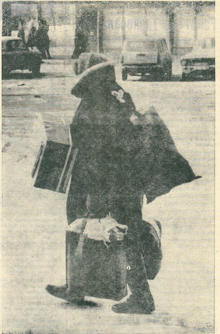
✱ Фотоэтюд Радиса Сибатуллина, п. Губкинский