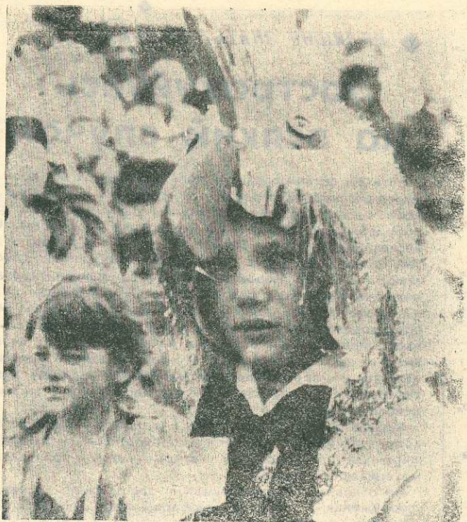
Фото репортаж в номер