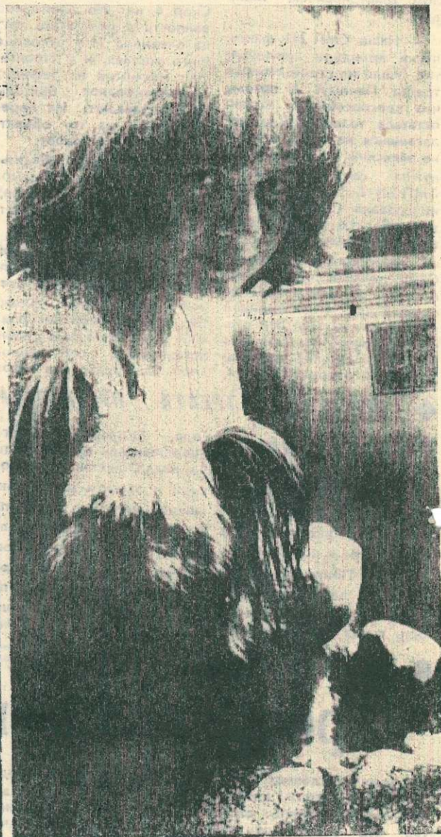
Наш фотовернисаж: «ДРУЗЬЯ».