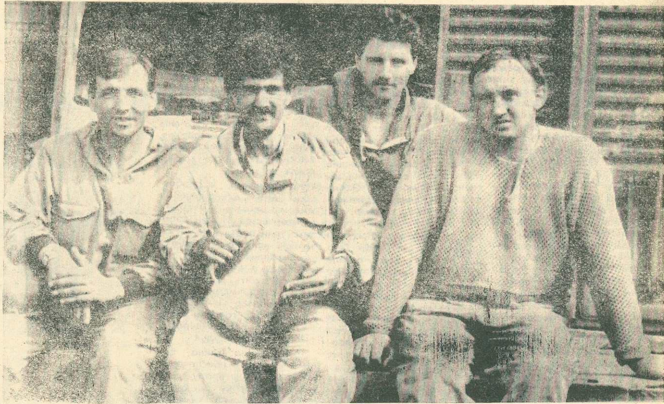
ЕСЛИ КОМУ НУЖНО ОТПРАВИТЬ НА ЗЕМЛЮ ВАГОН С ГРУЗОМ, ВАМ НА ПОМОЩЬ ПРИДЕТ БРИГАДА ТАКЕ ЛАЖНИКОВ ИЗ БПТОИКА. ДЛЯ ЭТОГО НУЖНО ТОЛЬКО ПРЕДЪЯВИТЬ НА СТАНЦИЮ ПЕРЕЧЕНЬ ОТПРАВЛЯЕМОГО ГРУЗА С СООТВЕТСТВУЮЩИМИ ДОКУМЕНТАМИ

ОТ РЕДАКЦИИ. Напоминем читателям, что на публикацию А. Кустова «Кто поставит заслон утечке товаров из района» в «СЛ» №77 от 20.07.91 (а это тоже было официальным заявлением в милицию), никакого ответа от руководства РОВД мы до сих пор не получили. Сколько будем ждать ответа на новый вопрос А. Кустова?