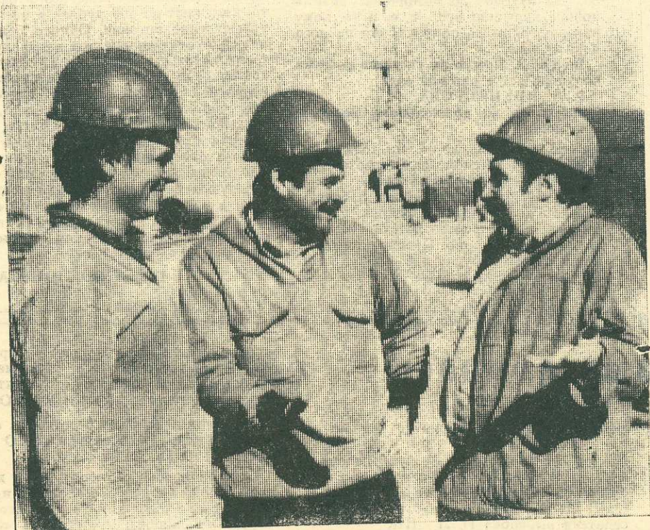
Фото Радиса СИБАГАТУЛЛИНА, п. Губкинский.