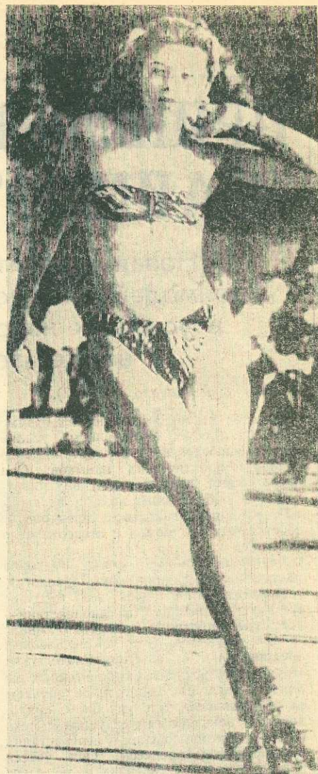
Неужели и у нас это будет?

сторожа, стропальщик с окладом 900 руб., бульдозерист тракторист на трелевочник — оклад 2000 руб. За справками обращаться по телефону 2-11-68.