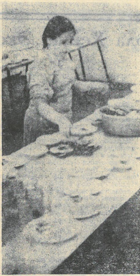
святая обязанность накрыть столы и убрать в зале.