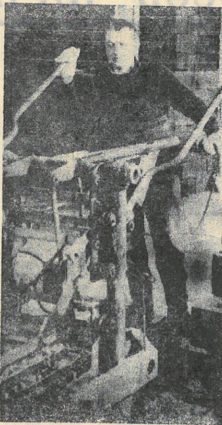
Филия предприятия. Вопрос находится в стадии доработки.