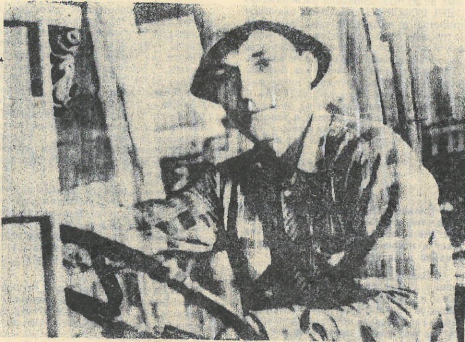
Тяжелый труд у рабочих цеха по выпуску пескоблоков. Цементная пыль забивает глаза, нос. Требуется физическая сила и выносливость, чтобы перебросать лопатой тонны песка, по несколько раз поднять и переложить с места на место тяжелый «кирпич».

Но жаловаться как-то здесь не привыкли. Работают.