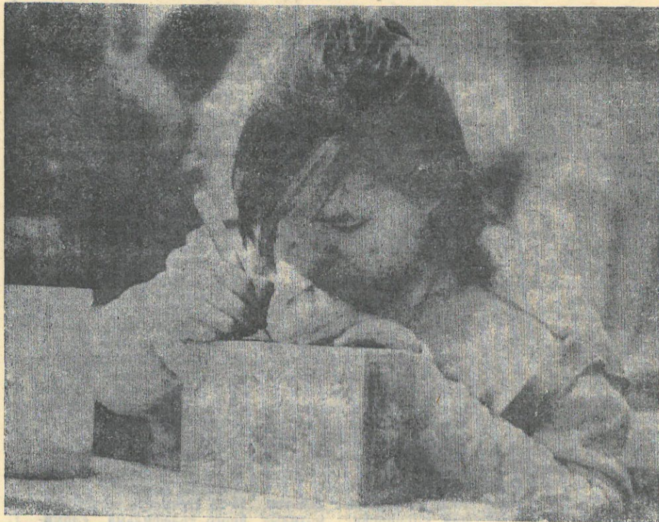
«БУДЕТ КРАСИВАЯ ВЕЩИЦА»