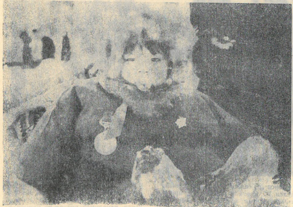
НОВЫЕ ГРАЖДАНЕ. ХОЗЯИН ТУНДРЫ.