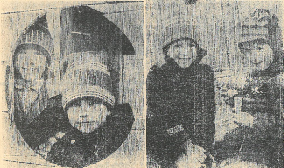
РОДНЫЕ МОИ МАЛЫШКИ...