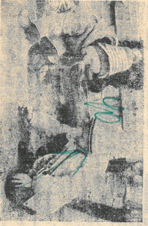
Говорят, что дни идут, время бежит, а годы летят. Приходит совсем не много времени, а уже мальчишки бегут собирать школьные ранцы. Как важно, чтобы вместе с терзаниями и радостями жизни они взяли в школу и дружелюбие.