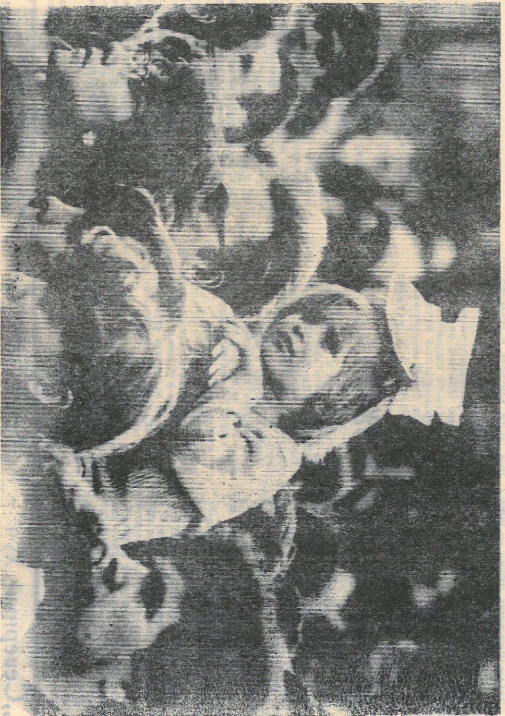
Мгновенья жизни: маленькая помощница: что день грядущий нам готовит.